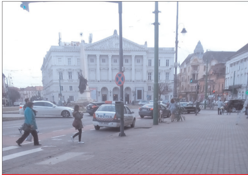
Ei au voie, că doară e de la Poliție. Chiar dacă nu de la cea Rutieră tot ar trebui să cunoască semnificația indicatoarelor rutiere și faptul că pe piste de biciclete nu se parchează